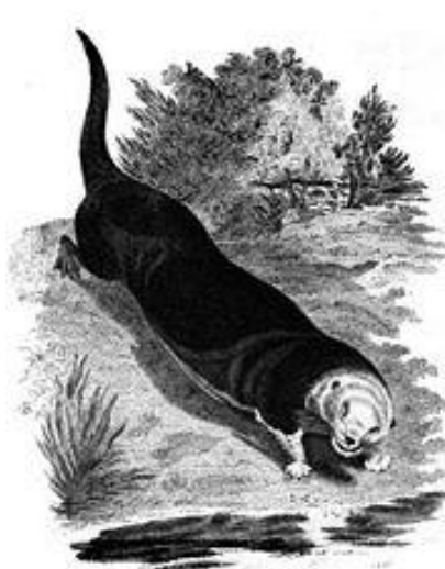
Калан ( Enhydra lutris ) в бухте Морро. Зарисовка по описанию Стеллера, Калифорния XIX век