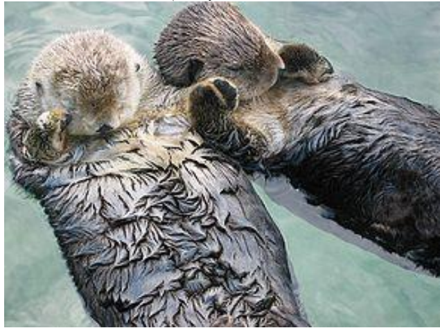
Каланы спят, держась за передние лапы. Распространено мнение, что каланы засыпают, держа друг друга за передние лапы или завернувшись в водоросли, чтобы их не унесло в открытое море (или не прибывало к берегу)