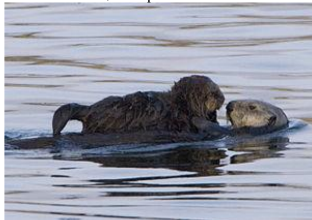
Маленький калан на груди у матери

Детеныши обычно рождаются в воде, редко на суше. Мать сразу же начинает вылизывать их, таким образом, загоняя воздух в мех, так что малыш держится на поверхности как пробка. К шести месяцам малыш покрывается настоящей шерстью.