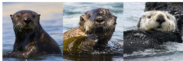
Варианты окраски каланов на примере калифорнийского калана ( Enhydra lutris nereis )