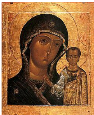
Казанская икона Пресвятой Божией Матери

После этого они пошли штурмом на Москву и выгнали поляков. В Кремле в плену у