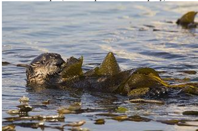
Калан, завернувшийся в водоросли

Внедрение каланов в эти опустошенные воды, а с ними и поглощение морских ежей, восстановило флору и фауны в прибрежных водах.